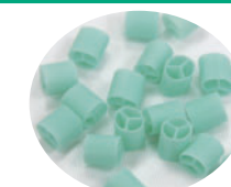
クッションビーズ

特殊なクッションビーズ素材を使用し、心地よい触感で適度な体圧分散性をもっています。体重がかかり中身がつぶされても通気空間があるため、ムレにくくなっています。